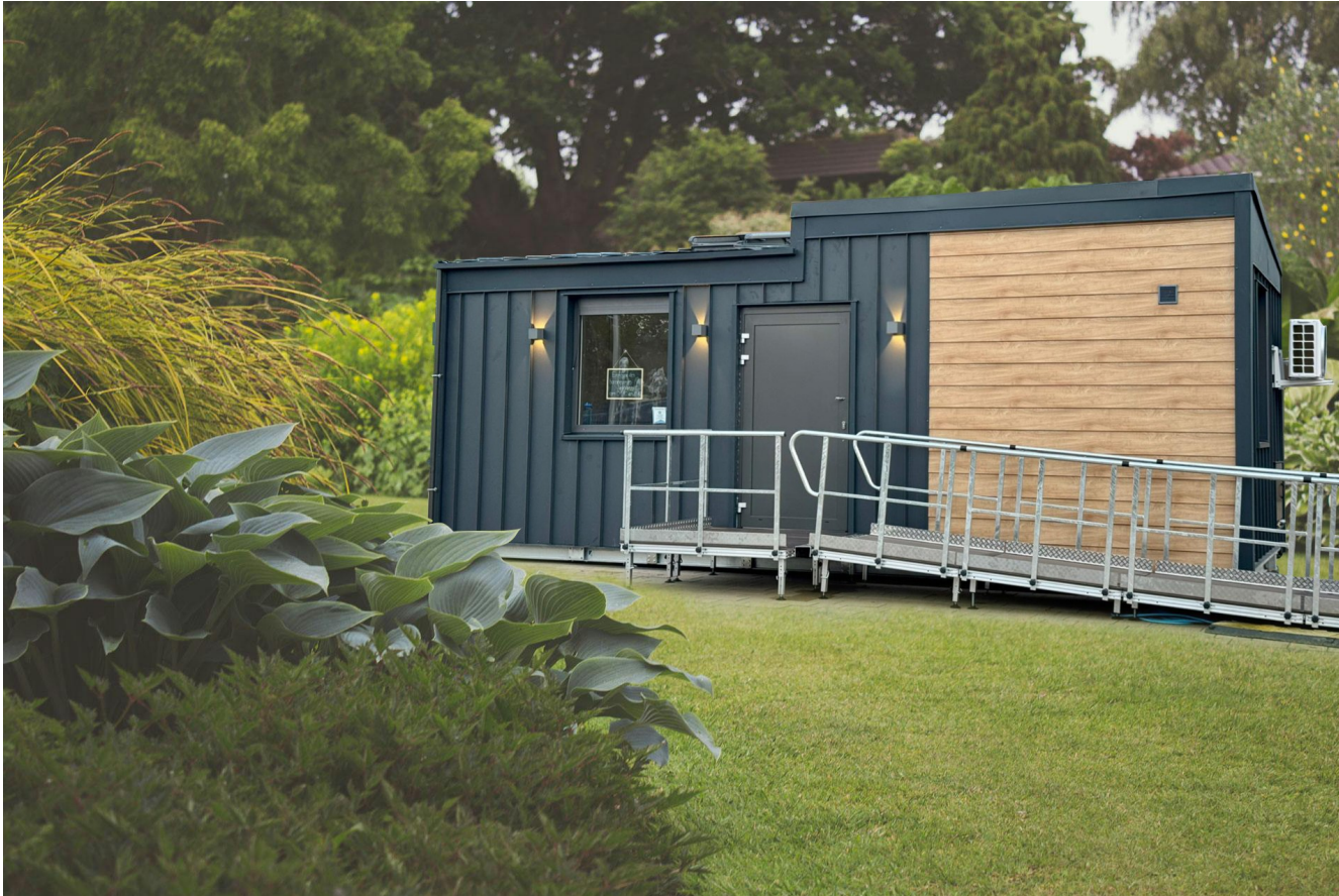
Bild vom TinyCareHome